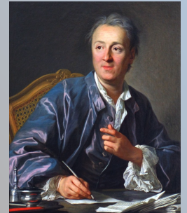
DIDEROT 1713 1784