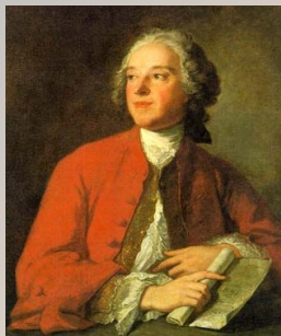
BEAUMARCHAIS 1732 1799