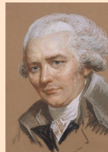
Choderlos de 1741 LACLOS 1803