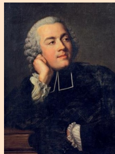
Abbé PRÉVOST 1697 1763