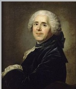
MARIVAUX 1688 1763