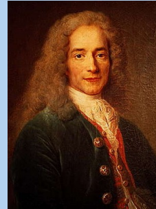
VOLTAIRE 1694 1778